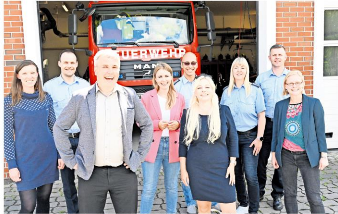
Der Kooperationsvertrag in Lehnitz unterzeichnet – das Projekt „Feuerwehr macht Schule“ kann in Lehnitz beginnen.